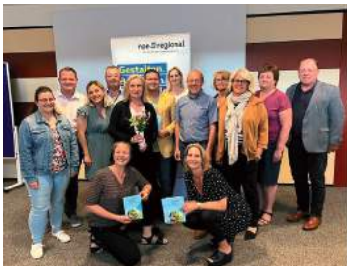
Foto: VertreterInnen der Kleinregion Schwarzatal bei der Regionssitzung in der Sparkasse Neunkirchen