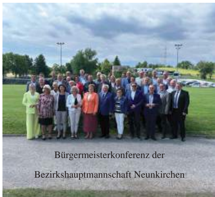
Bürgermeisterkonferenz der Bezirkshauptmannschaft Neunkirchen

Abschließend möchte ich mich bei Ihnen allen für das gute Miteinander und die angenehmen Gespräche